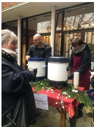
Punsch und Lebkuchen zur großen Freude unserer Gäste

Von so einer breit angelegten Hilfe fühlen wir uns besonders getragen.