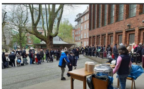
warten auf die Ausgabe

Für uns bedeutet dies zunächst einmal eine längere Verteilung mit mehr ehrenamtlichen Helfern.